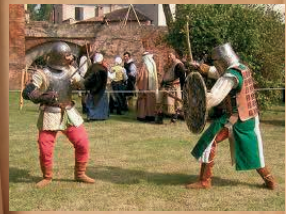
Compagnia d'arme "Vergine di Ferro" Livorno (li)