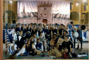
Gruppo Sbandieratori "Borgo e Valle" Città di Levanto (sp)