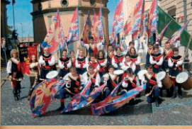
Musici e Sbandieratori Auree Fenici Pontremoli (ms)