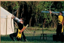
Arcieri de lo "Spino Fiorito" Massa (ms)