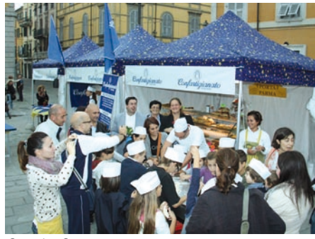
Stand a Sarzana