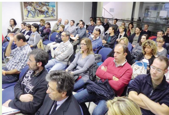
Tavola rotonda in Confartigianato su Formazione 2.0 e Sicurezza

L'Assessore Rossetti «Dal 2007 al 2013 abbiamo impegnato 329 milioni di euro del FSE per la formazione»