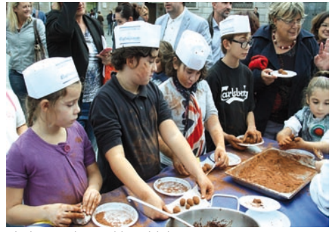
Laboratorio per i bambini