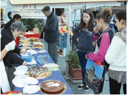
La Spezia - Stand Ail