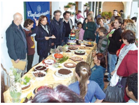
Bocca di Magra Gara di torte