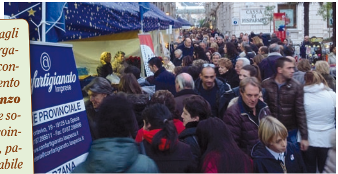
La Spezia - Corso Cavour

Da ottobre a dicembre la provincia della Spezia è stata vivacizzata dagli eventi golosi di "Pane, cioccolato e..." , la kermesse del cioccolato organizzata dal Centro Assistenza di Confartigianato con il patrocinio e il contributo della Regione Liguria. Soddisfazione per la realizzazione dell'evento è stata espressa dall'Assessore Regionale alle Attività Produttive, Renzo Guccinelli : «Anche quest'anno – ha spiegato in una nota - la Regione sostiene la manifestazione di Confartigianato che anima la provincia e coinvolge oltre 300 imprese del territorio tra alimentaristi, cioccolaterie, pasticcerie, gelaterie, pizzerie, bar, ristoranti, un evento oramai immancabile nell'autunno del levante ligure». La manifestazione ha coinvolto i comuni di Levanto, Bocca di Magra, Sarzana, Follo, Sesta Godano, Porto Venere, La Spezia, Beverino con eventi in strada, mercati dei prodotti tipici e degustazioni. Una manifestazione che non è stata solo un evento "da piazza" e che ha coinvolto molti operatori in un progetto di promozione dedicato al "food & beverage", spostandosi nei locali con cene a tema e presentazione delle serate da parte di esperti in enogastronomia e alla presenza dei produttori.