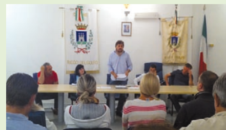
Riccò del Golfo

Confartigianato La Spezia ha seguito con attenzione i tavoli di concertazione che hanno deliberato i piani finanziari e regolamenti della Tares ottenendo agevolazioni e riduzioni tariffarie. Un dato emerge chiaramente, la normativa Tares si sta dimostrando un salasso per le imprese e per i negozianti. Si parla di aumenti a due cifre, superiori al 60% in alcuni comuni. Alcuni si ritroveranno con l'imposta raddoppiata, ovviamente senza aver raddoppiato la mole di rifiuti prodotti; altri che potranno provare dati alla mano che la produzione non genera rifiuti o che smaltiscono separatamente i rifiuti speciali dovranno pagare lo stesso salvo una piccola riduzione! La nostra provincia paga inoltre un conto ancora più salato per i contratti di servizio di Acam e per la difficile situazione aziendale. Sono troppe però le differenze tra comuni anche limitrofi, per singole voci, e nei costi a carico della collettività. Nonostante l'azione sindacale di Confartigianato è evidente che le scelte che hanno guidato la maggior parte delle Amministrazioni nell'applicazione della Tares sono state di due tipi: