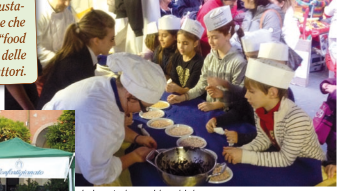
Laboratorio per i bambini